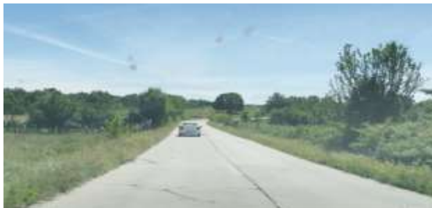
DJ74A Sector de drum km 17+600 si 25+600