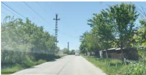
DJ74A Sector de drum km 17+600 si 25+600