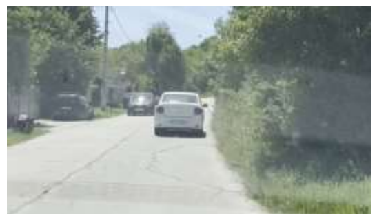
DJ663A Sector de drum km 2+710 – 12+364