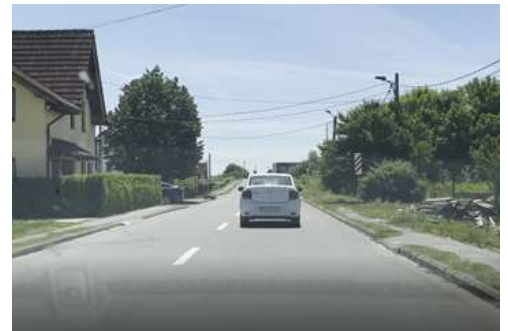
DJ663A Sector de drum km 0+000 – 2+710

Între pozițiile km 2+710 și 12+364 sectorul de drum cu sistem rutier rigid, prezintă următoarele degradări: