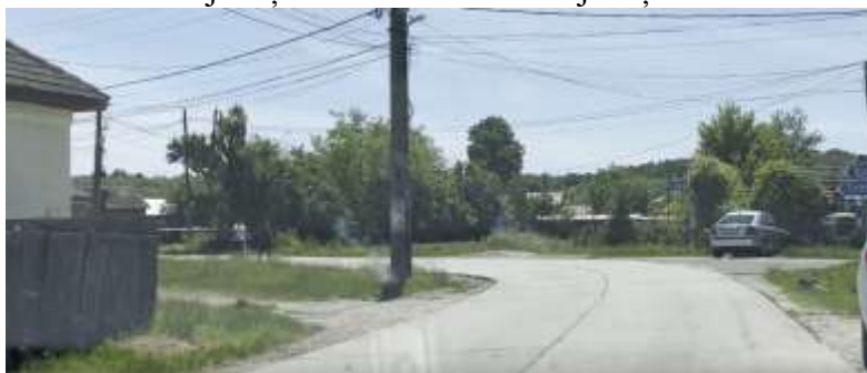
Figura 2.4: DJ663 Sector de drum km 11+035 și 11+095

Sectorul de drum analizat are o lungime de 60 m și este cuprins între km 11+035 și 11+095. Această porțiune asigură conexiunea drumului județean 663A cu drumul județean 674A.