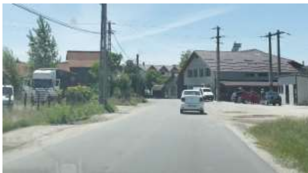
DJ74A Sector de drum km 25+600 si 26+420

În secțiunea transversală, drumul are următoarea alcătuire: